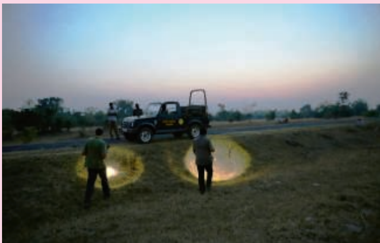
Wandelsafari tussen de tijgers.