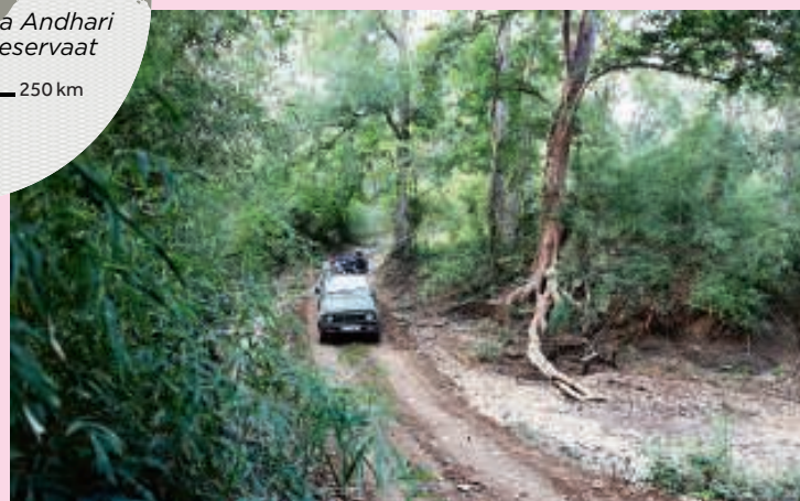
In de Maruthi door het teak- en bamboebos.

echt van alles naar beneden gooien. In Tadoba staan ook twee dorpen vol kleine Mowgli's. Maar iedereen komt hier voor de tijger; de oranje reuzenkat met zijn gouden ogen. We verdringen ons met tientallen andere jeeps op kansrijke plekken, we verliezen langzaam de moed en druisen af richting toiletblok. Op de terugweg wijst de safarigids naar voren en roept dolblij: 'Tijger! Tijger!'