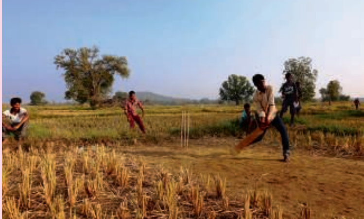
India betaalt 11.000 euro per verslonden familielid.