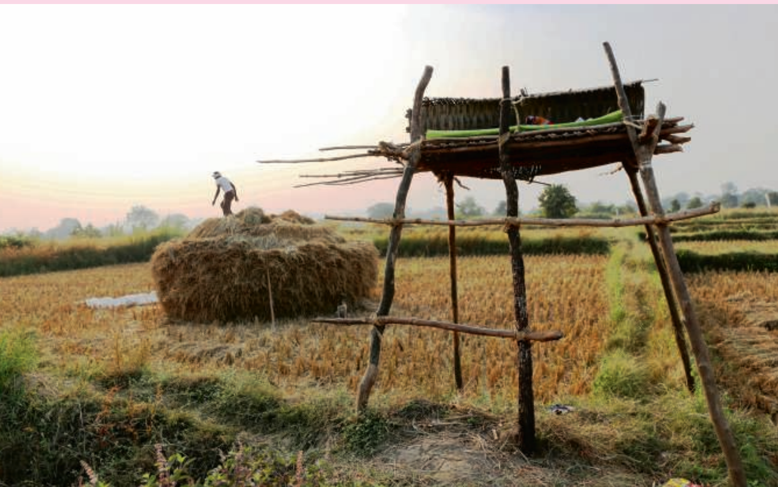
De keerzijde van het toenemende aantal tijgers: doodsbangе boeren slapen op machaans, platforms.

gaurs, tijgers en luipaarden gewoon over het terrein van de Jungle Lodge (ze geloven niet in hekken in India). Je kunt er buiten slapen op je terras en dan hoor je hoeven tikken en de lippenbeer snuiven als een kapotte stofzuiger. De tijger, zegt Dhanwatay, klinkt als een mens die op blote voeten door het bos loopt. Wederom: wie op safari gaat in India, moet zijn oren gebruiken.