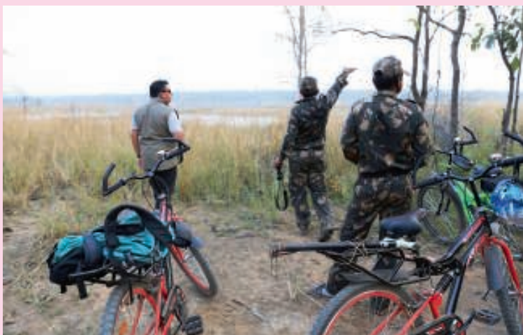
De eerste fietssafari door het tijgergebied.